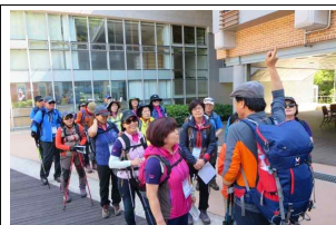
△ 일반등산 교육