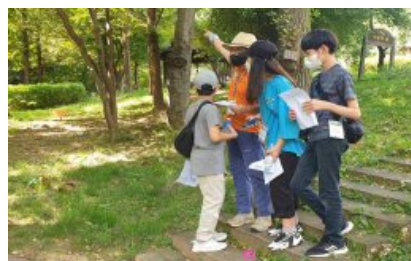
△ 스탬프 플레이