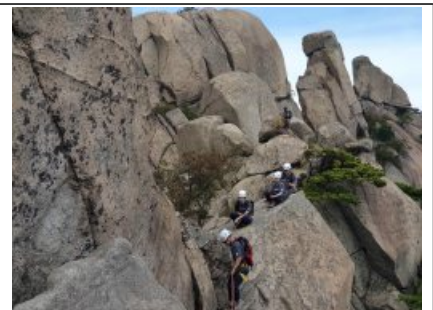
△ 자연암벽 등반