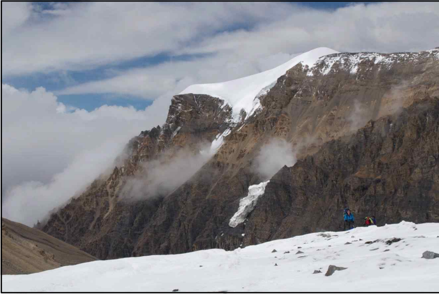
<전진캠프 가는 길 전경>