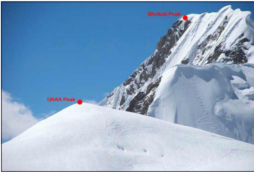
<브리쿠티 히말과 UAAA피크>