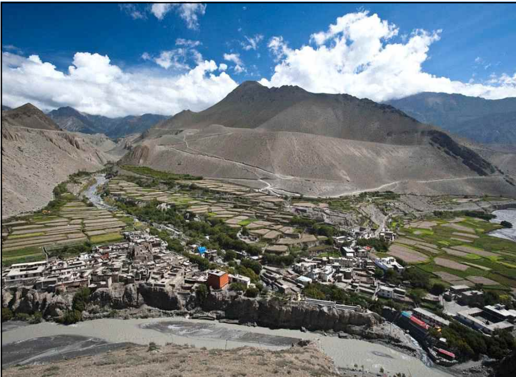
<무스탕 지역의 입구인 카그베니 지역 전경>