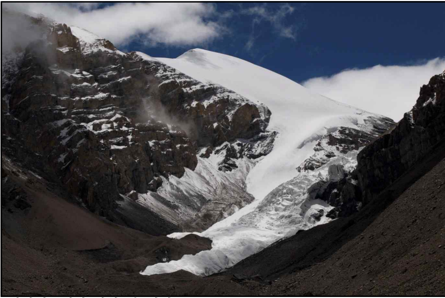
<전진캠프에서 바라 본 전경>