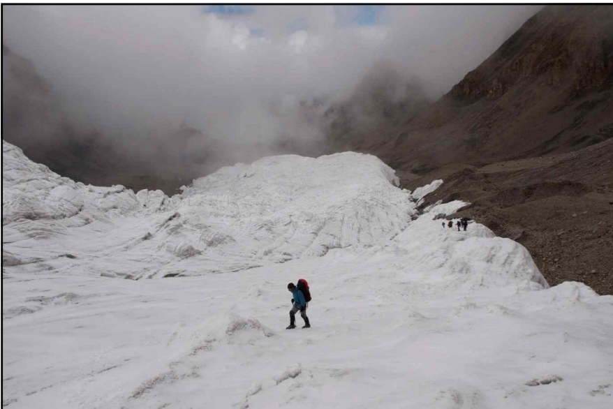
<정상 가는 길>