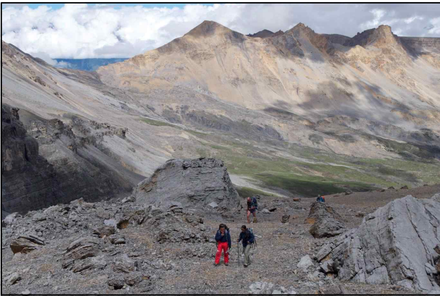
<베이스캠프 가는 길>