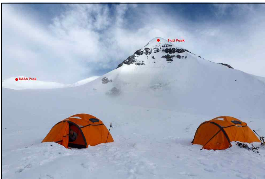
<푸티 피크와 UAAA피크 전경>