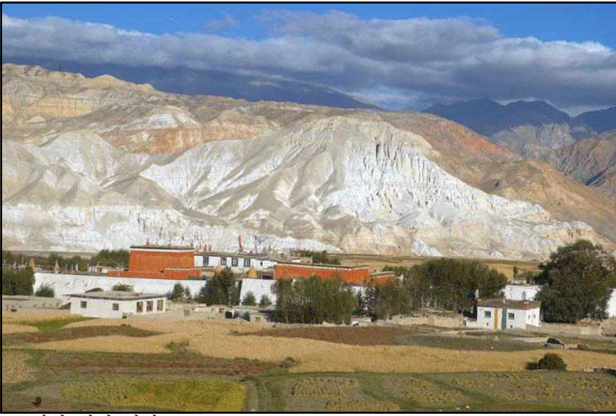
<로만탕 지역 전경>