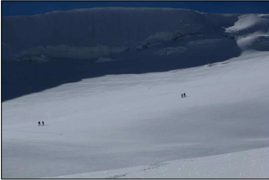
<정상 가는 길_02>