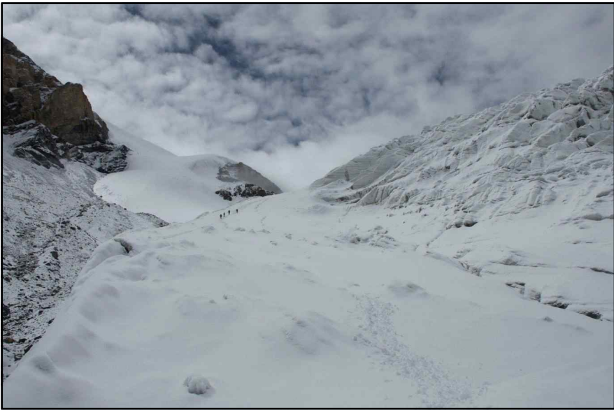
<전진캠프에서 바라 본 전경_02>